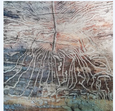
Spannend, die Gänge eines Eschenbastkäfers

Wir wünschen Ihnen einen schönen Spaziergang.