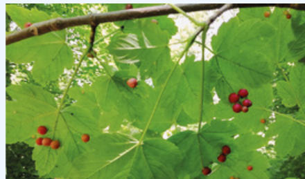
Schon mal gesehen? Galläpfel der Gallwespen am Berg-Ahorn

Zur Auswahl stehen die sechs, mittlerweile heimisch gewordenen Baumarten: Berg-Ahorn, Elsbeere, gewöhnliche Esche, gewöhnliche Rosskastanie, Silber-Weide und Stiel-Eiche. Eine weitere Tafel erklärt, warum Baumtorsos so wertvoll sind.