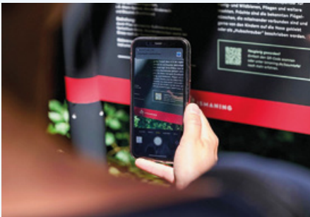
Die Baumtafeln in der Isarau erklären spannende Naturereignisse – mehr Informationen gibt es nach einem Scan des QR-Codes

Warum sind manche Kastanienblätter um diese Jahreszeit braun? Wer lebt alles auf oder in einem Baum? Woran erkennt man eine Eiche? Was können wir Menschen mit dem Holz herstellen? ... Fragen über Fragen, die uns die Natur aufgibt.